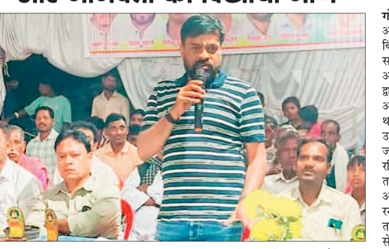
हरिभूमि न्यूज ►► पलारी